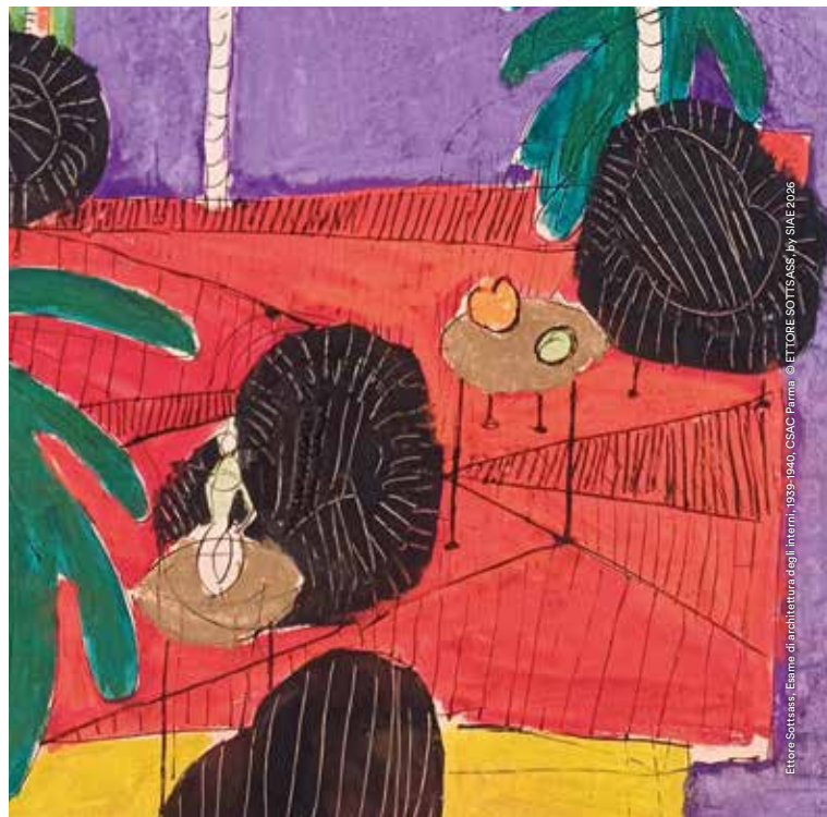
Ettore Sottsass: 'Leame di architettura degli Interni, 1939-1940