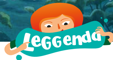
Illustrazione di Lorenzo Sangio