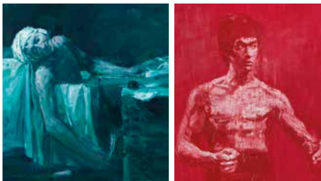
Yan Pei-Ming Les Funérailles de Monna Lisa (det.), 2009. (cover) Marat (13 July 1793, Paris) (det.), 2014. Bruce Lee, 2007.

Palazzo Strozzi presenta Yan Pei-Ming. Pittore di storie , la più importante mostra mai dedicata in Italia a uno dei principali maestri della pittura contemporanea. L'esposizione mette in evidenza la potente e originale ricerca dell'artista franco-cinese, in un cortocircuito visivo tra esperienze individuali ed eventi storici, simboli e icone della cultura tra Oriente e Occidente. Yan Pei-Ming invita a ripensare il rapporto tra memoria e presente, storia e contemporaneità . I suoi soggetti spaziano infatti tra immagini private, copertine di giornali, dipinti antichi, still cinematografici, immagini iconiche della storia recente. Si alternano così nature morte e paesaggi, ritratti della madre e del padre o di personaggi come Bruce Lee, Mao Zedong, Aldo Moro, Pier Paolo Pasolini, Vladimir Putin e Volodymyr Zelensky, insieme a originali reinterpretazioni di celebri opere della storia dell'arte come Monna Lisa di Leonardo, La morte di Marat di David o Innocenzo X di Velázquez. Caratterizzate da dimensioni spesso monumentali, le tele esaltano un rapporto diretto e quasi brutale con i propri modelli attraverso uno stile di grande impatto, basato su pennellate vigorose e ampie. Yan Pei-Ming stesso si definisce "pittore d'assalto" , e infatti attacca la tela con energia, quasi in un corpo a corpo con la materia pittorica.